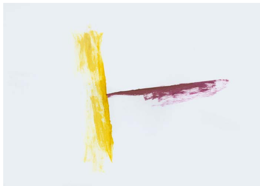
skicy - kresba 1