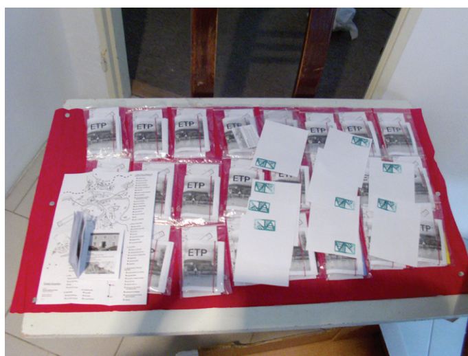
Egonův tajný průvodce Českým Krumlovem s mapou, zabaleny v zip sáčku