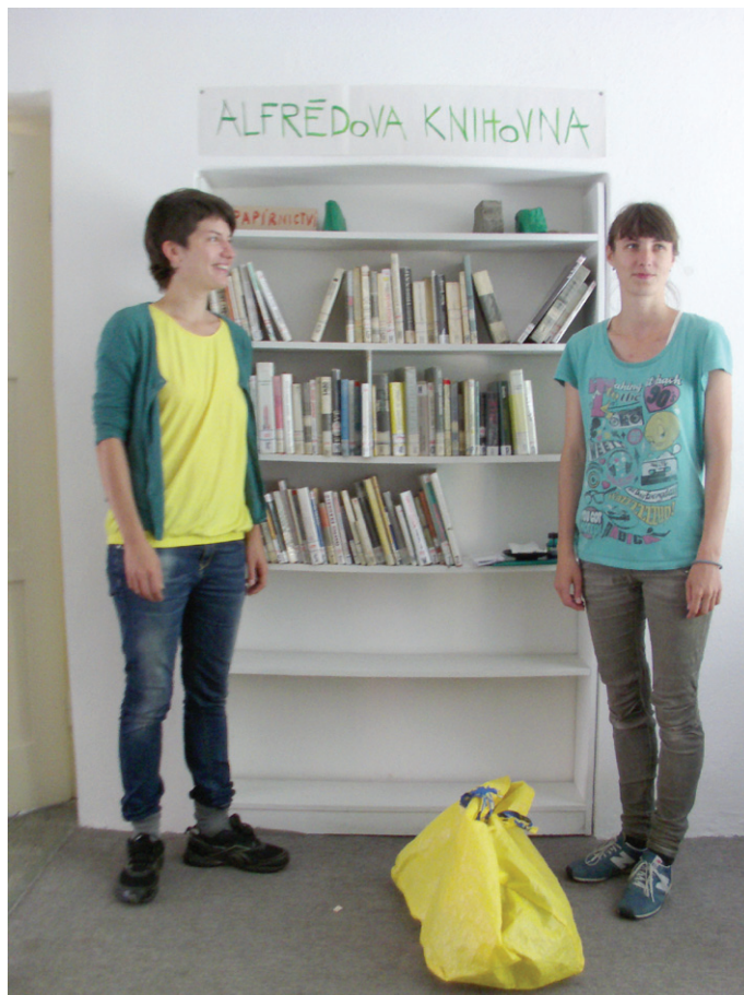
Alfrédova knihovna, 31. srpna 2014

informační samolepka v každé knize Alfrédovy knihovny