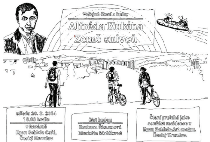
pozvánka na veřejné čtení z knihy Alfréda Kubina Země snivců