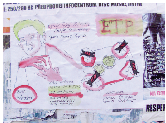
pozvánka na křest Egonova tajného průvodce Českým Krumlovem