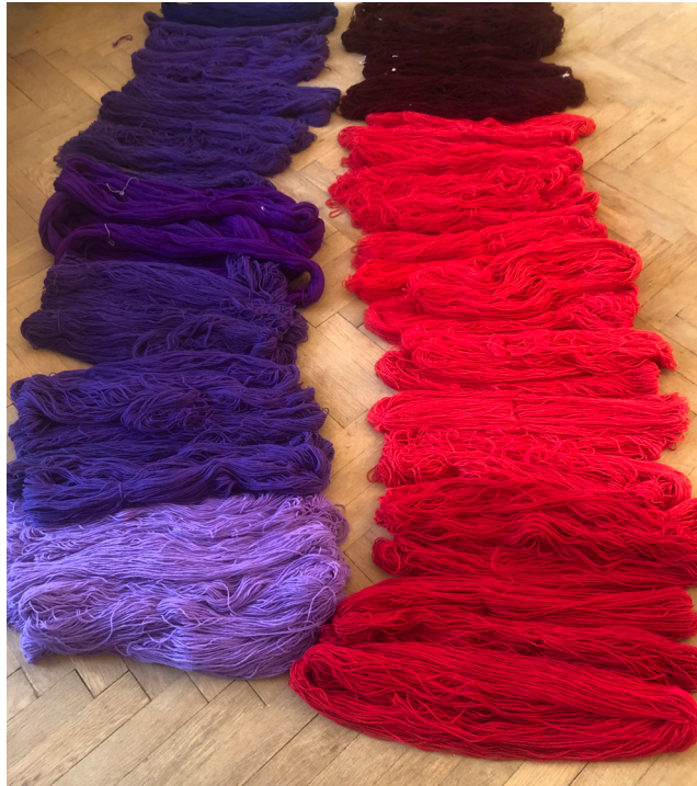
Sušení přízí pro tapiserii