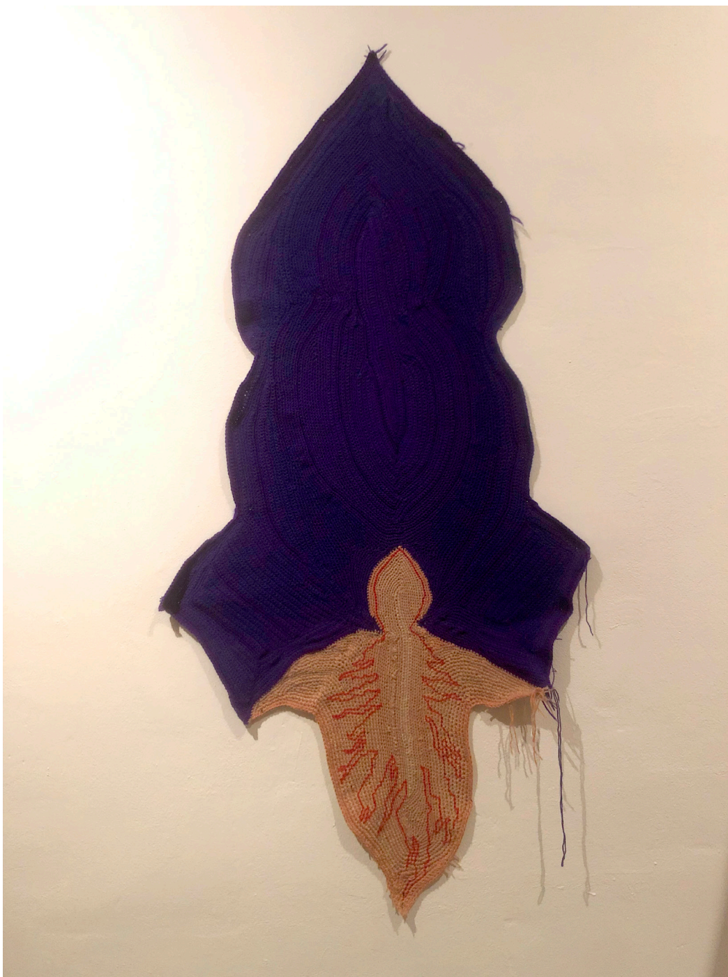
Leaking sounds of the angel's hole, háčkování a vyšívání, vlna