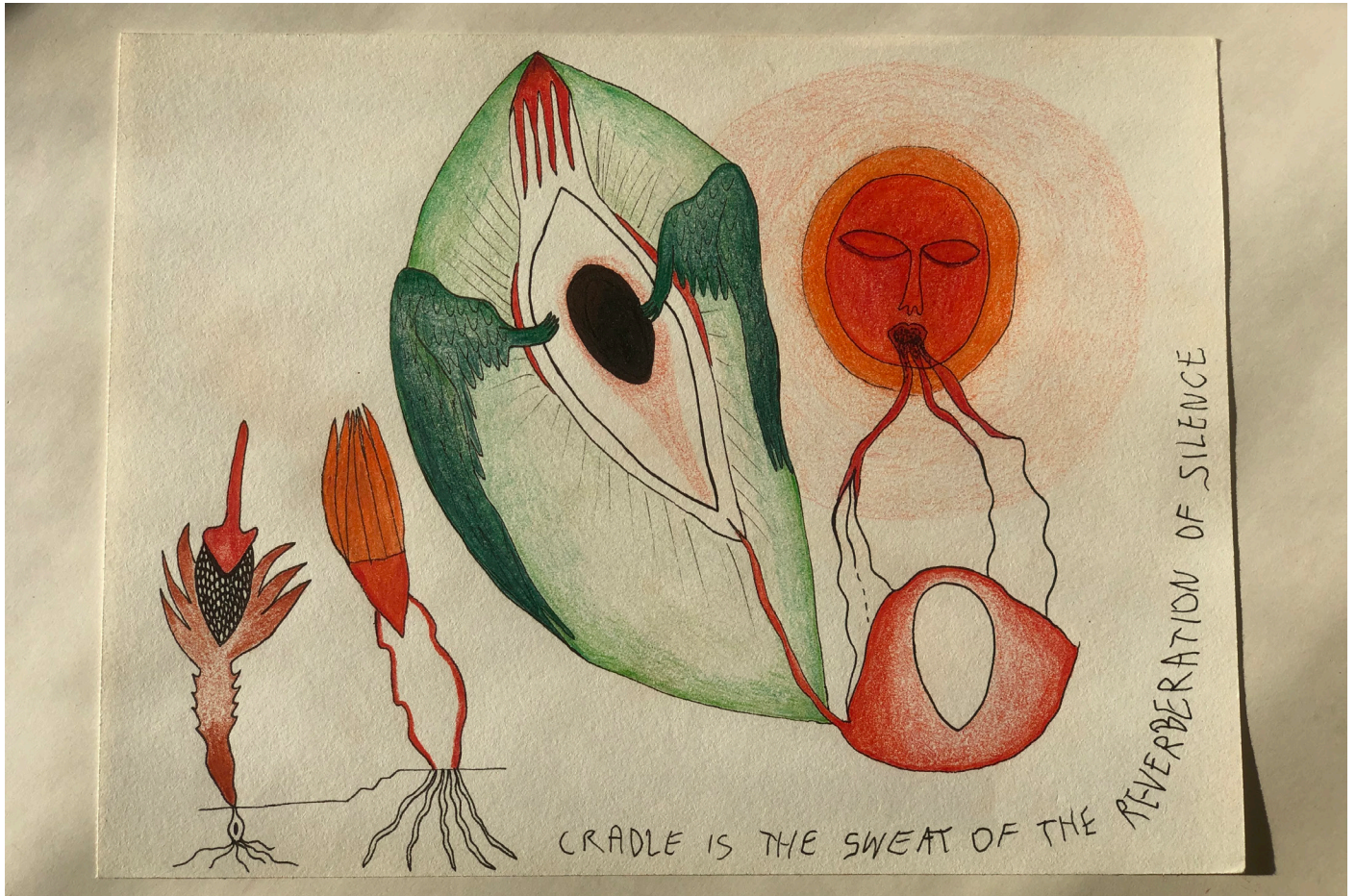
Cradle is the sweat of the reverberation of silence, pastelky a fixa na papíře