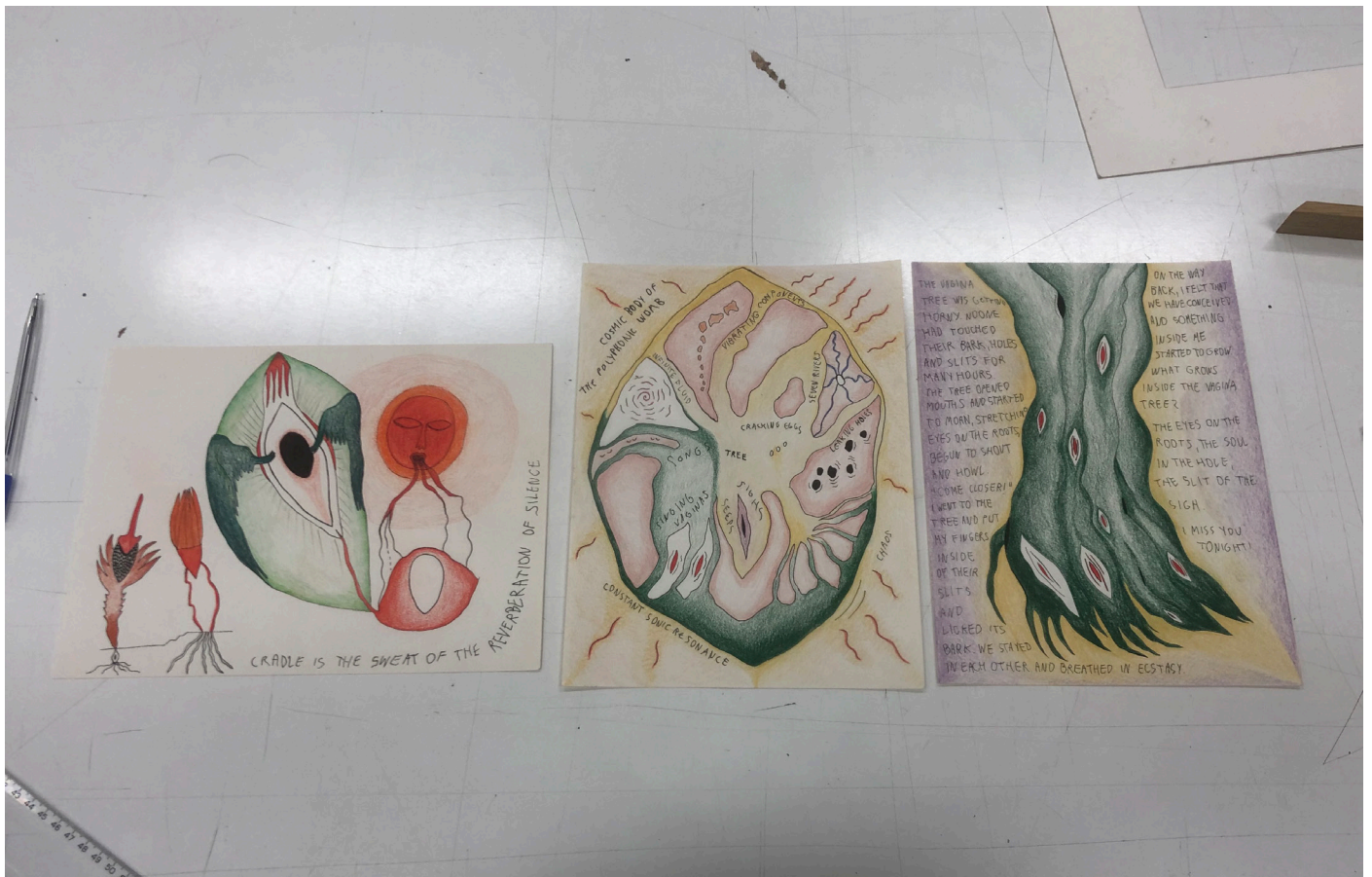
Kresby Pastelky na papíře