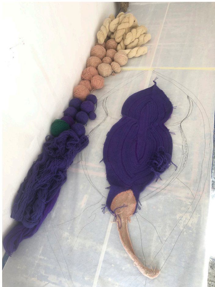
Výroba tapiserie: Leaking sounds of the angel's hole Háčkování a vyšívání